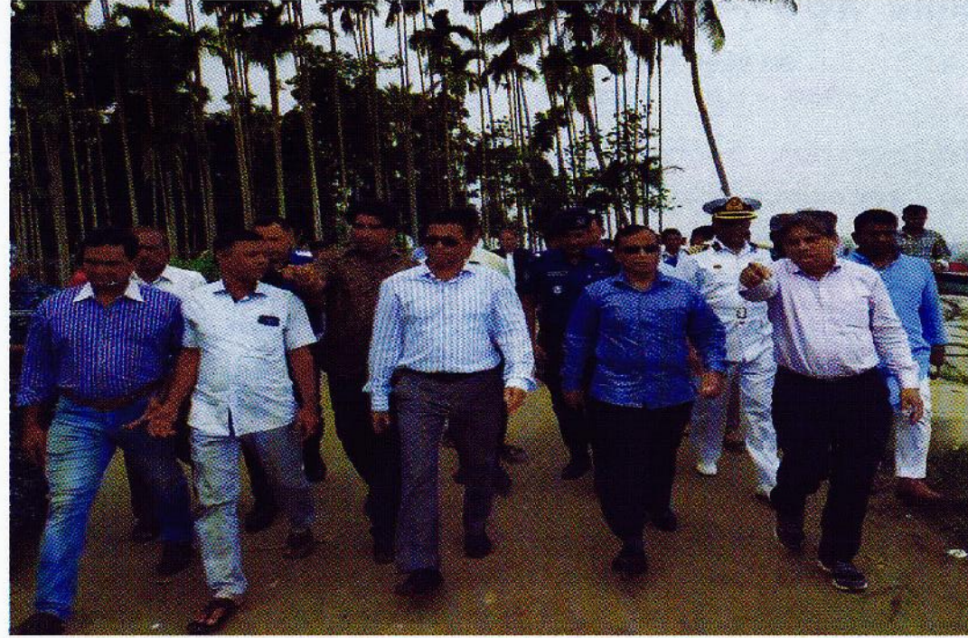
ভাঙ্গন কবলিত এলাকা পরিদর্শন করছেন পানি সম্পদ প্রতিমন্ত্রী জাহিদ ফারুক ও উপমন্ত্রী এ কে এম এনামুল হক শামীম