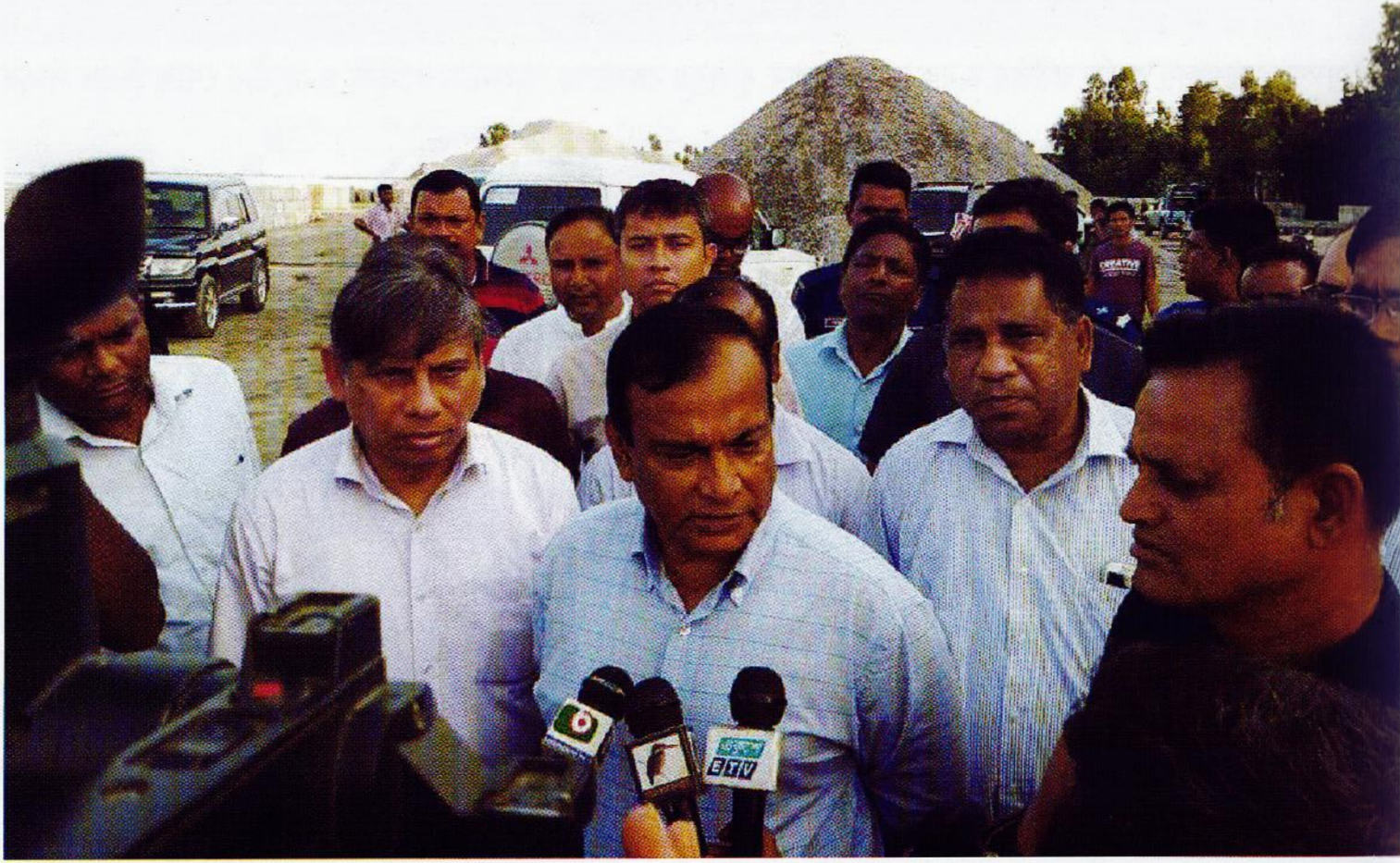
তিস্তা প্রকল্প পরিদর্শনকালে বক্তব্য রাখছেন পানি সম্পদ প্রতিমন্ত্রী জাহিদ ফারুক