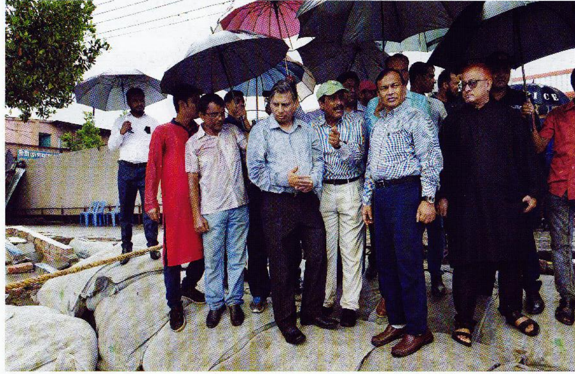
চাঁদপুর জেলার পুরান বাজার এলাকায় ভাঙন পরিদর্শন করছেন পানি সম্পদ প্রতিমন্ত্রী জাহিদ ফারুক