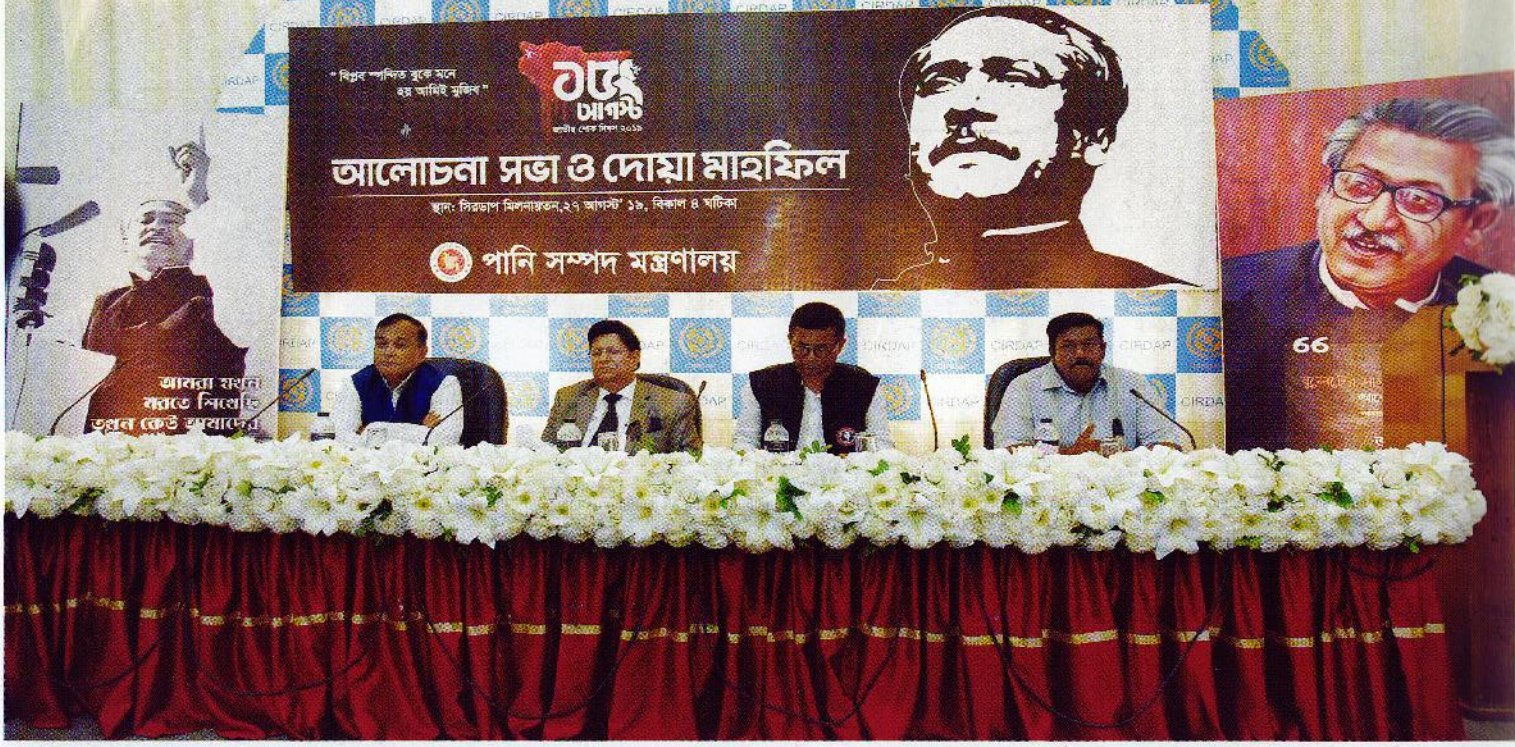
আলোচনা সভা ও দোয়া মাহফিলে বক্তব্য রাখছেন পররাষ্ট্রমন্ত্রী এ কে এম আব্দুল মোমেন।

পানি সম্পদ মন্ত্রণালয় কর্তৃক জাতির জনক বঙ্গবন্ধু শেখ মুজিবুর রহমানের শাহাদাত বার্ষিকী ও জাতীয় শোক দিবস পালন