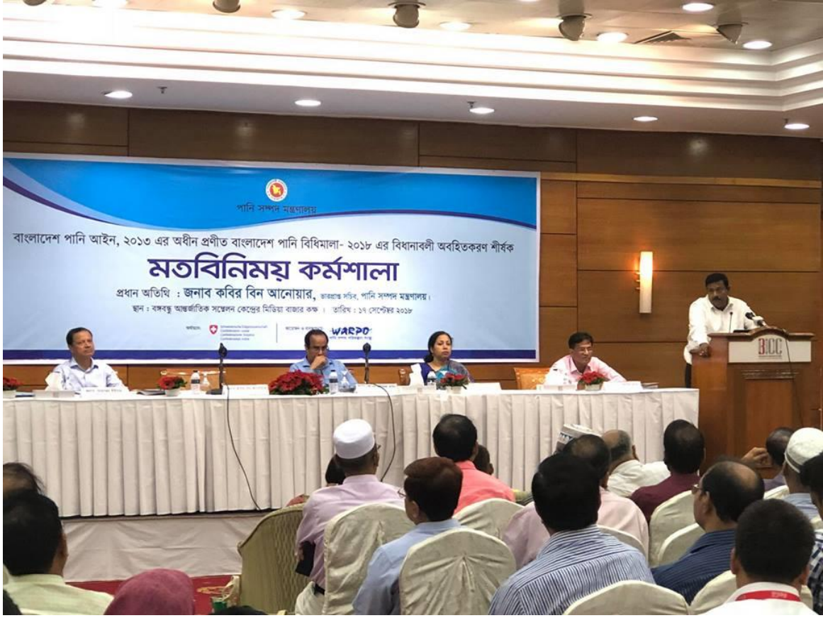
চিত্র: বাংলাদেশ পানি আইন, ২০১৩ এর অধীন প্রণীত বাংলাদেশ পানি বিধিমালা, ২০১৮ এর বিধানাবলী অবহিতকরণের লক্ষ্যে পানি সম্পদ পরিকল্পনা সংস্থা (ওয়ারপো) কর্তৃক আয়োজিত মতবিনিময় কর্মশালা, ১৮ সেপ্টেম্বর, ২০১৮।