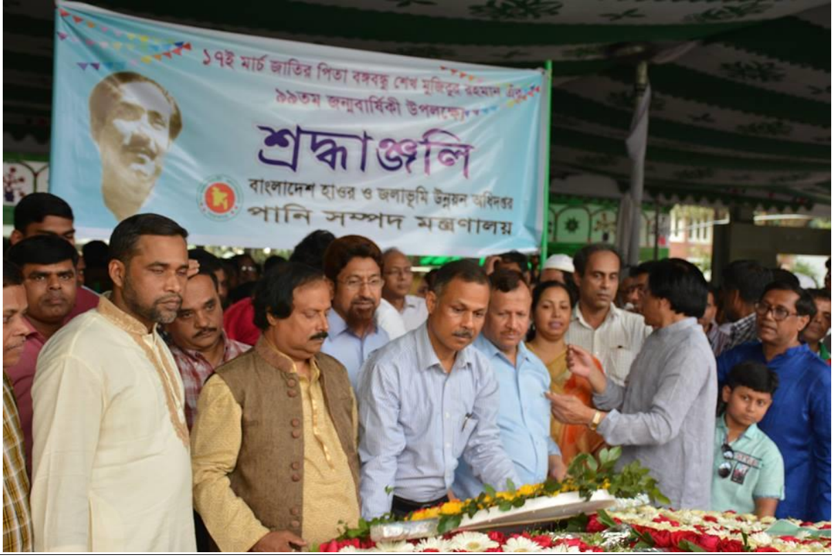
চিত্র: জাতির জনক বঙ্গবন্ধু শেখ মুজিবুর রহমানের ৯৯তম জন্মবার্ষিকী উদযাপন উপলক্ষ্যে পানি সম্পদ পরিকল্পনা সংস্থার পক্ষ থেকে পুষ্প স্তবক অর্পণ; ১৭ মার্চ ২০১৯।