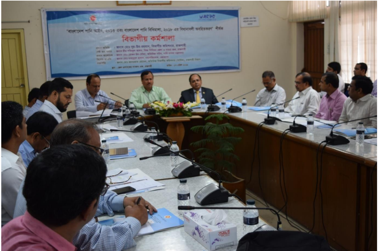
চিত্র: বাংলাদেশ পানি আইন, ২০১৩ এবং বাংলাদেশ পানি বিধিমালা, ২০১৮ এর বিধানাবলী অবহিতকরণের লক্ষ্যে বিভাগীয় কর্মশালা, জেলা প্রশাসকের সম্মেলন কক্ষ, রাজশাহী, ২৯ এপ্রিল, ২০১৯।