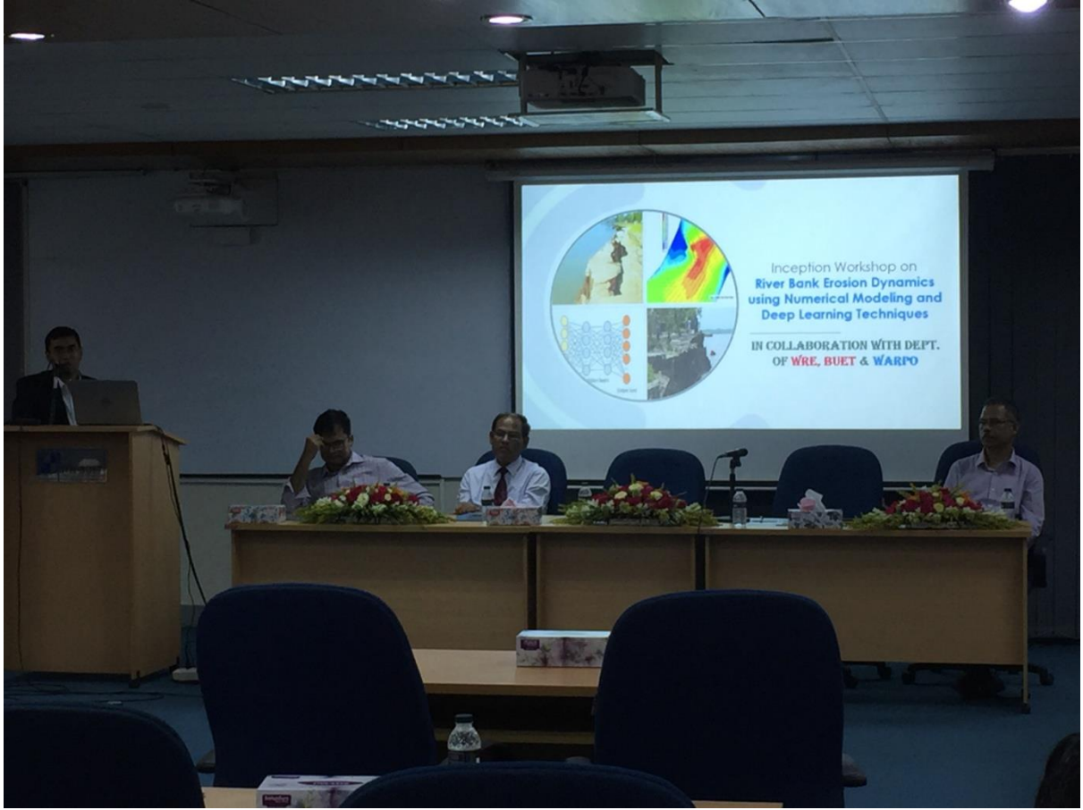
চিত্র: Research on River bank erosion dynamics using Numerical Modeling and Deep learning Techniques” শীর্ষক গবেষণা কার্যক্রমের Inception Workshop; বুয়েট, ০৪/০৫/২০১৯।

৩.২.২) বাংলাদেশ প্রকৌশল বিশ্ববিদ্যালয়ের ইনস্টিটিউট অব ওয়াটার এন্ড ফ্লাড ম্যানেজমেন্ট (IWFM) এর সাথে “বাংলাদেশের দক্ষিণ-পশ্চিম অঞ্চলের পলি (Sediment) ব্যবস্থাপনা” শীর্ষক গবেষণা কার্যক্রম পরিচালনা করা হচ্ছে। পলি ব্যবস্থাপনা বাংলাদেশের জন্য একটি চ্যালেঞ্জ, বিশেষ করে দক্ষিণ-পশ্চিম অঞ্চলের জন্য অত্যন্ত প্রয়োজনীয়। প্রকল্পটির প্রধান উদ্দেশ্য হচ্ছে এমন একটি পলি ব্যবস্থাপনা কৌশল তৈরি করা যার মাধ্যমে পলি প্রতুল অঞ্চল হতে পলি অপ্রতুল অঞ্চলে সরিয়ে দেওয়া। ১৮ মাস মেয়াদি প্রকল্পটি জুন ২০১৯ হতে শুরু হয়েছে।