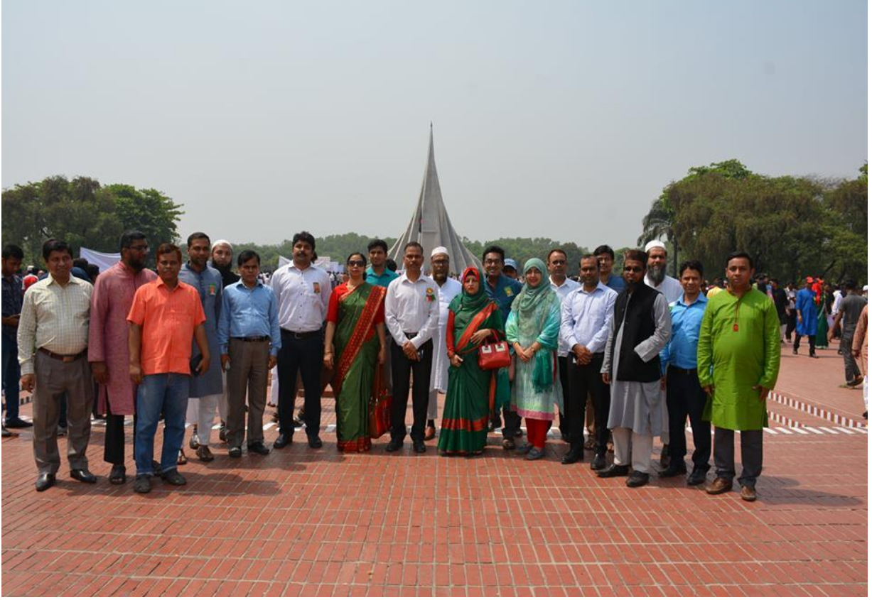
চিত্র: জাতীয় স্মৃতিসৌধে পানি সম্পদ পরিকল্পনা সংস্থার উদ্বর্তন কর্মকর্তাগণ; ২৬ মার্চ ২০১৯।